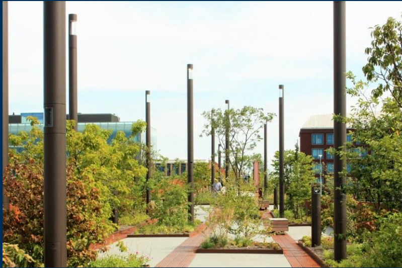
Parkbrug (voetgangersbrug) in Den Bosch