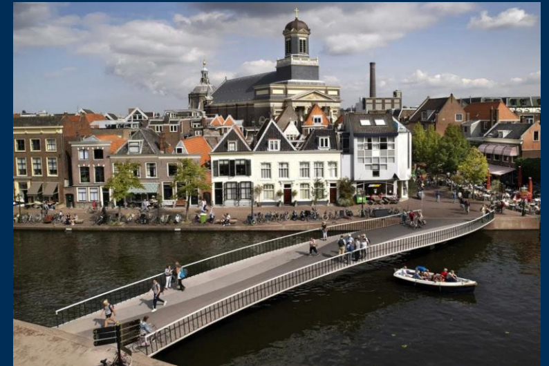
Catharinabrug (fiets-en voetgangersbrug) in Leiden