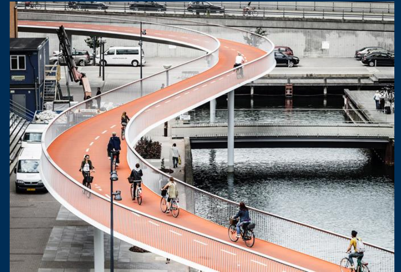
Cykelslangen (fietsbrug) in Kopenhagen