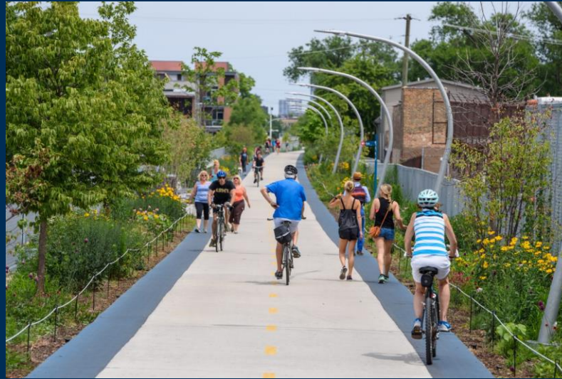
Higline (fiets- en voetgangersbrug) in Chicago